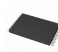
AT28HC64B-70TU Microchip Technology IC EEPROM 64KBIT 70NS 28TSOP