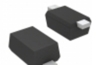
BAS 3005B-02V H6327 Infineon Technologies DIODE SCHOTTKY 30V 500MA SC79-2