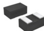
BAS 3010S-02LRH E6327 Infineon Technologies DIODE SCHOTTKY 30V 1A TSLP-2