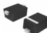
BAS 16-02W E6327 Infineon Technologies DIODE GEN PURP 80V 200MA SCD80-2