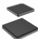
AT40K20-2EQI Microchip Technology IC FPGA 20K GATES 240QFP