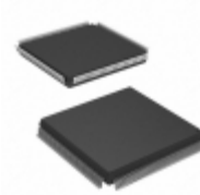
AT40K20AL-1CQC Microchip Technology IC FPGA 20K GATES 160QFP