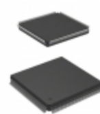
AT40K20AL-1DQI Microchip Technology IC FPGA 20K GATES 208QFP