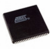
AT40K20AL-1AJC Microchip Technology IC FPGA 20K GATES 84PLCC