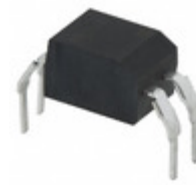
FOD617DW AMI Semiconductor / ON Semiconductor OPTOISOLATOR 5KV TRANSISTOR 4DIP