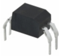
FOD617DW Fairchild/ON Semiconductor OPTOISOLATOR 5KV TRANSISTOR 4DIP