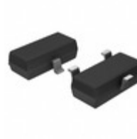
MCP1703AT-2052E/CB Microchip Technology IC REG LDO 2.05V 0.2A SOT23A