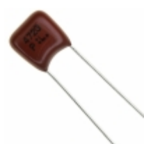
ECQ-P1H472GZ Panasonic Electronic Components CAP FILM 4700PF 2% 50VDC RADIAL