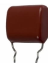
ECQ-P1H434FZW Panasonic Electronic Components CAP FILM 0.43UF 1% 50VDC RADIAL