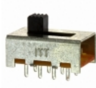
OS203013MT8QN1 C&K SWITCH SLIDE DP3T 300MA 30V