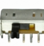
OS203011MA2QP1 C&K SWITCH SLIDE DP3T 100MA 12V