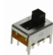
OS203013MT6QN1 C&K SWITCH SLIDE DP3T 200MA 30V