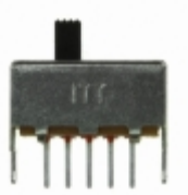
OS203011MV9QN1 C&K SWITCH SLIDE DP3T 100MA 30V