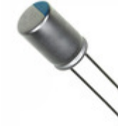
477ALG025MGBJ Illinois Capacitor CAP ALUM POLY 470UF 20% 25V T/H