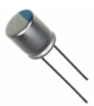
477AVG016MFF Illinois Capacitor CAP ALUM POLY 470UF 20% 16V T/H