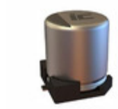
477AXZ016M Illinois Capacitor CAP ALUM 470UF 20% 16V SMD