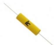
477BPA016M Illinois Capacitor CAP ALUM 470UF 20% 16V AXIAL