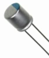
477AVG016MFBJ Illinois Capacitor CAP ALUM POLY 470UF 20% 16V T/H