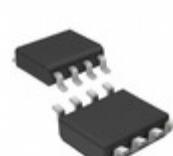
HCF40107M013TR STMicroelectronics IC GATE NAND 2CH 2-INP 8-SOIC