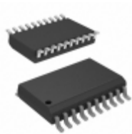
PIC16F18444-I/SO Micrel / Microchip Technology COMPARATOR, DAC, 12-BIT ADCC