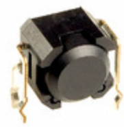
DSBA1H NKK Switches SENSOR TILT SW 30-60DEG 20MA TH