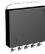
BAJ2DD0WHFP-TR Rohm Semiconductor IC REG LDO 12V 2A HRP5