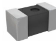
LQP03TN2N4C02D Murata Electronics North America FIXED IND 2.4NH 500MA 200 MOHM