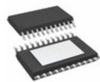
TC62D722CFNG,C,EL Toshiba Semiconductor and Storage IC LED DRIVER LIN 90MA 24HTSSOP