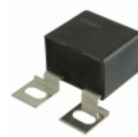
MKP386M522160YT8 Vishay BC Components CAP FILM 2.2UF 5% 1.6KVDC SCREW