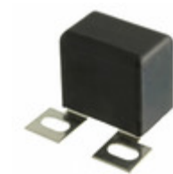
MKP386M522160YT6 Vishay BC Components CAP FILM 2.2UF 5% 1.6KVDC SCREW