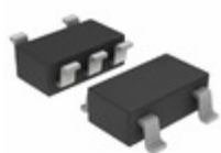
NLAST4501DTT1G ON Semiconductor IC SWITCH SPST 5TSSOP