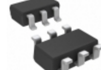
NLAST4599DTT1G ON Semiconductor IC SWITCH SPDT 6TSSOP