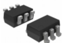
NLAST4599DFT2 ON Semiconductor IC SWITCH SPDT SC88