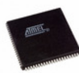
AT40K20AL-1AJC Microchip Technology IC FPGA 20K GATES 84PLCC