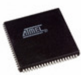
AT40K20LV-3AJI Microchip Technology IC FPGA 3.3V 1024 CELL 84PLCC