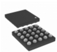
AD7877ACBZ-REEL7 ADI (Analog Devices, Inc.) IC CTRLR TOUCH SCREEN 25- WLCSP