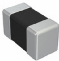
CIM05U301NC Samsung Electro-Mechanics America, Inc. FERRITE BEAD 300 OHM 0402 1LN