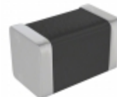
CIM10J121NC Samsung Electro-Mechanics America, Inc. FERRITE BEAD 120 OHM 0603 1LN