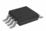
ADG752BRMZ Analog Devices Inc. IC VIDEO SWITCH SPDT 8MSOP