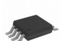
ADG752BRM-REEL Analog Devices Inc. IC VIDEO SWITCH SPDT 8MSOP