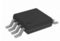
ADG752BRMZ-REEL7 Analog Devices Inc. IC VIDEO SWITCH SPDT 8MSOP