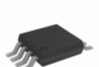
ADG751BRMZ Analog Devices Inc. IC VIDEO SWITCH SPST 8MSOP