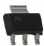
MIC5239-2.5BS TR Microchip Technology IC REG LDO 2.5V 0.5A SOT223