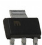
MIC5239-2.5YS Microchip Technology IC REG LDO 2.5V 0.5A SOT223