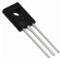
BD137 ON Semiconductor TRANS NPN 60V 1.5A TO-252AA