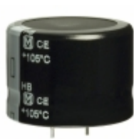
ECO-S2DB821EA Panasonic Electronic Components CAP ALUM 820UF 20% 200V SNAP