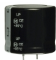
ECO-S2DP102EA Panasonic Electronic Components CAP ALUM 1000UF 20% 200V SNAP