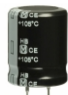
ECO-S2DB471CA Panasonic Electronic Components CAP ALUM 470UF 20% 200V SNAP