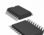
PIC16C56A-20/SO Microchip Technology IC MCU 8BIT 1.5KB OTP 18SOIC