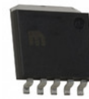
MIC37252BR TR Microchip Technology IC REG LDO ADJ 2.5A SPAK-5