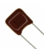
ECQ-B1H333JF Panasonic Electronic Components CAP FILM 0.033UF 5% 50VDC RADIAL