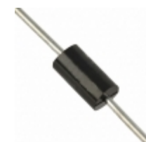
1N5396 Fairchild/ON Semiconductor DIODE GEN PURP 500V 1.5A DO15