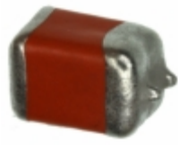
13008-071KESC Electro-Films (EFI) / Vishay CAP TANT 15UF 50V 10% 2917