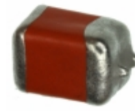
13008-071MESA Vishay Sprague CAP TANT 15UF 50V 20% 2917