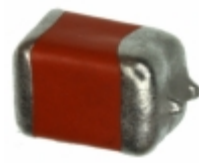
13008-071KESZ/HR Vishay Sprague CAP TANT 15UF 50V 10% 2917