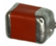
13008-071KESZ Electro-Films (EFI) / Vishay CAP TANT 15UF 50V 10% 2917