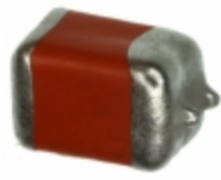
13008-071KESC/HR Electro-Films (EFI) / Vishay CAP TANT 15UF 50V 10% 2917