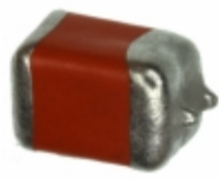
13008-071MESA Electro-Films (EFI) / Vishay CAP TANT 15UF 50V 20% 2917