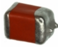
13008-071KESZ Vishay Sprague CAP TANT 15UF 50V 10% 2917