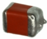
13008-071MESA/HR Electro-Films (EFI) / Vishay CAP TANT 15UF 50V 20% 2917