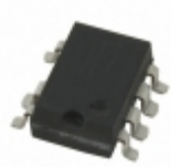
NCP1014APL100R2G ON Semiconductor IC CTRLR/MOSFET 100KHZ 7DIPGW