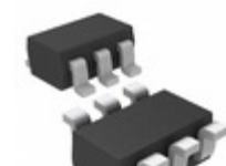
MAX4481AXT+T Maxim Integrated IC OPAMP GP 140KHZ RRO SC70-6