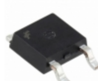
MC7810ECDTX Fairchild/ON Semiconductor IC REG LDO 10V 1A TO252-3