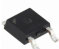
MC7810ECDTXM Fairchild/ON Semiconductor IC REG LDO 10V 1A TO252-3