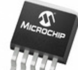
TC1267VETTR Microchip Technology IC REG LDO 3.3V 400MA PCI 5DDPAK