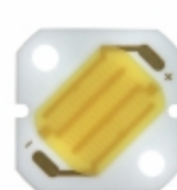
GW5BNF15L10 Sharp Microelectronics LED MOD 7WATT ZENIGATA 6500K