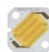
GW5BNC15L02 Sharp Microelectronics LED MOD 3.5WATT ZENIGATA 5000K