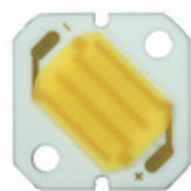
GW5BNC15L12 Sharp Microelectronics LED MOD 3.5WATT ZENIGATA 6500K