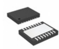
LTC4223IDHD-2#TRPBF ADI (Analog Devices, Inc.) IC CNTRLR HOT SWAP DUAL 16-DFN