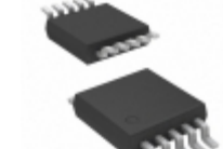
MCP665-E/UN Microchip Technology IC OPAMP GP 60MHZ RRO 10MSOP