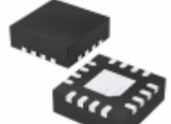
MCP669-E/ML Microchip Technology IC OPAMP GP 60MHZ RRO 16QFN