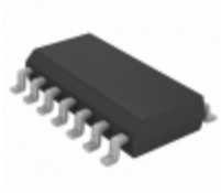
MCP6424T-E/SL Microchip Technology IC OP AMP QUAD 90KHZ 14SOIC