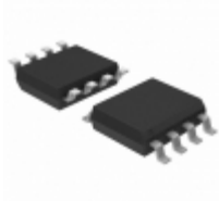
MIC2951-4.85BM Microchip Technology IC REG LDO 4.85V/ADJ 0.15A 8SOIC