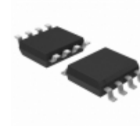
MIC2951-4.85BM-TR Microchip Technology IC REG LDO 4.85V/ADJ 0.15A 8SOIC