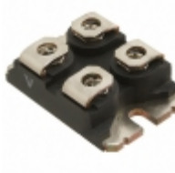
VS-UFB80FA20 Electro-Films (EFI) / Vishay DIODE MODULE 200V 40A SOT227