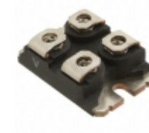
VS-UFB80FA20 Vishay Semiconductor Diodes Division DIODE MODULE 200V 40A SOT227