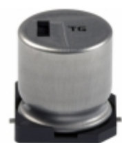
EEV-TG1E681UQ Panasonic Electronic Components CAP ALUM 680UF 20% 25V SMD