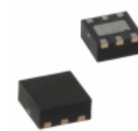
MIC5259-4.75YML-TR Microchip Technology IC REG LDO 4.75V 0.3A 6MLF