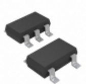
MIC5259-4.75BD5-TR Microchip Technology IC REG LDO 4.75V 0.3A TSOT23-5