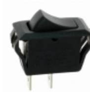
CRE22F2BBBNE ZF Electronics SWITCH ROCKER SPST 20A 125V