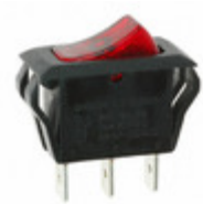
CRE22F2BBRLE ZF Electronics SWITCH ROCKER SPST 20A 125V