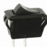
CRE22F2FBBNE ZF Electronics SWITCH ROCKER SPST 20A 125V