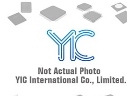
IRL540STRRPBF IR IR TO-263