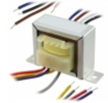
VPL36-300 Triad Magnetics XFRMR PWR 36V 0.28A CHASSIS