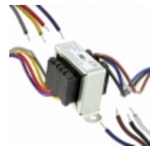
VPL28-180 Triad Magnetics XFRMR PWR 28V 0.18A CHASSIS