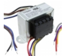
VPL36-700 Triad Magnetics XFRMR PWR 36V 0.7A CHASSIS