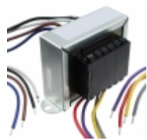
VPL36-1400 Triad Magnetics XFRMR PWR 36V 1.389A CHASSIS