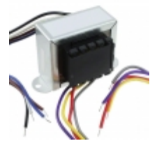
VPL26-930 Triad Magnetics XFRMR PWR 26.8V 0.93A CHASSIS