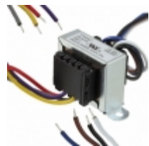
VPL36-140 Triad Magnetics XFRMR PWR 36V 0.14A CHASSIS