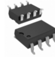
HCPL-2531-300E Broadcom Limited OPTOISO 3.75KV 2CH TRANS 8DIPGW