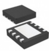
MCP6N16T-001E/MF Microchip Technology IC OP AMP INSTR 8DFN