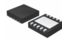
LT3973EDD#TRPBF Linear Technology IC REG BUCK ADJ 0.75A 10DFN