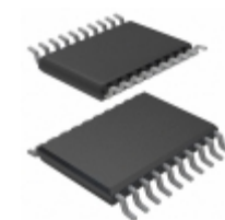
AT86RF401U-6GS Microchip Technology IC MICRO TRANSM RF W/AVR 20TSSOP