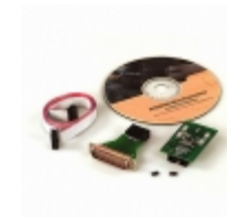
AT86RF401E-EK1 Microchip Technology KIT DEMO MICRO TX EVAL 433MHZ