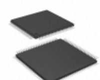
PIC24FJ64GA010T-I/PT Microchip Technology IC MCU 16BIT 64KB FLASH 100TQFP