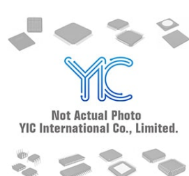
MIC68400-1.8YML MICREL MICREL MLF-16