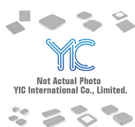
MIC69101-1.8YML MICREL MIC69101-1.8YML MICREL