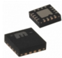
MIC68400-2.5YML-TR Microchip Technology IC REG LDO 2.5V 3A 16MLF