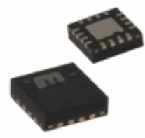
MIC68400-1.8YML-TR Microchip Technology IC REG LDO 1.8V 3A 16MLF