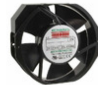
UF15AC12-BTHR-B1 Mechatronics FAN AXIAL 172X150X38MM 115VAC TA