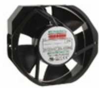
UF15AC12-BTHR Mechatronics FAN AXIAL 172X150X38MM 115VAC